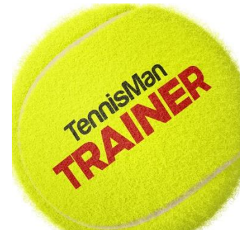
Der Betrieb ist nur mit diesen Tennisbällen gestattet