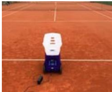
Aufstellort: Mitte des Platzes knapp hinter der Grundlinie

Bei auftretenden Funktionsstörungen ist die Maschine stillzulegen und Florian Ried zu benachrichtigen